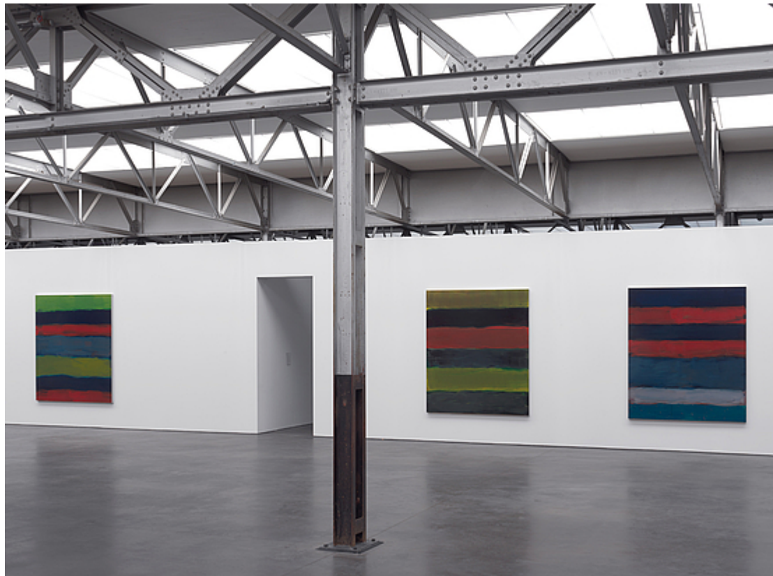
Impressie van de tentoonstelling van Sean Scully met links het aangekochte werk Landline River