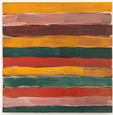
Landline Pink , 2016

Een centrale plaats in zijn tentoonstelling is gereserveerd voor de Landlines .